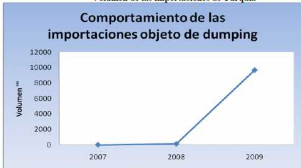
Volumen de las importaciones de Turquía